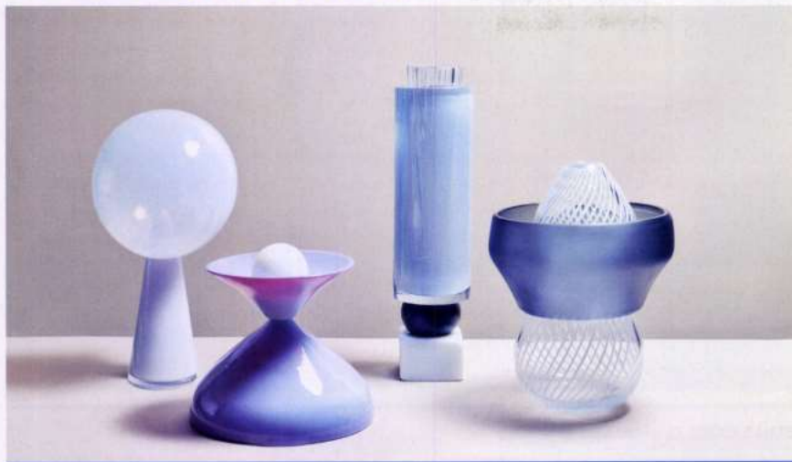
SOSPESI, Zanellato / Bortotto, The Gallery Bruxelles 2017