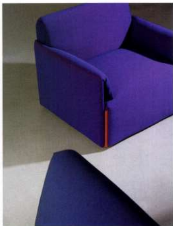
Poltrona COSTUME , Stefan Diez, Magis 2019