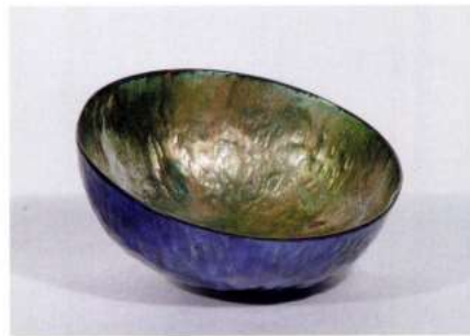
CIOTOLA SMALTATA , Paolo De Poli